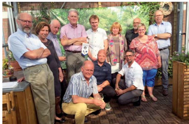
Vertegenwoordigers van Stichting Stalpaert van der Wiele, Fa. Zorgdrager en Stichting Hospice & VPTZ Delft tijdens installatie nieuwe sta-op stoelen

Die waren na jaren van intensief gebruik aan vervanging toe. Eén nieuwe stoel werd gesponsord door plaatselijke Rotary Club Vrijthof. Daarnaast ontvingen we ook van de Lions Club Delft een bijdrage voor een nieuwe stoel.