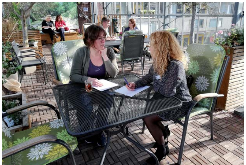
Aspirant vrijwilligers werken een groepsopdracht uit

Vrijwilligers krijgen ook de mogelijkheid landelijke trainingen, georganiseerd door de landelijke VPTZ organisatie, te volgen. Door vrijwilligers op tijd bij te scholen en verschillende taken aan te bieden, kan de organisatie ook meebewegen met ontwikkelingen en bovendien vergroot je niet alleen hun werkplezier, maar ook hun waarde op de arbeidsmarkt. Een aantal keer is een van onze vrijwilligers door de werkervaring in het hospice een opleiding in de gezondheidszorg gaan volgen; mooi dat wij daar een rol in hebben kunnen spelen!