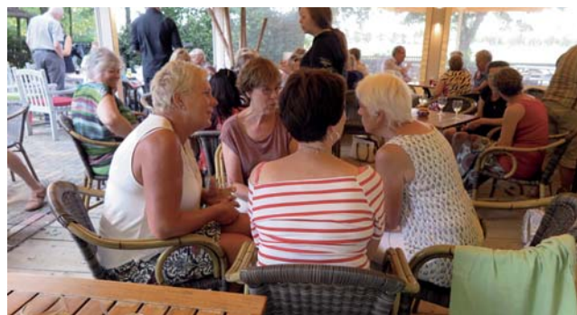
Gezellig samenzijn op de jaarlijkse barbecue

De barbecue voor al onze medewerkers en vrijwilligers zoals altijd uitstekend verzorgd door de mensen van restaurant "Onder Ons". Ieder jaar fijn om even bij elkaar te komen en in een ontspannen sfeer te genieten van elkaars gezelschap en het heerlijke eten.