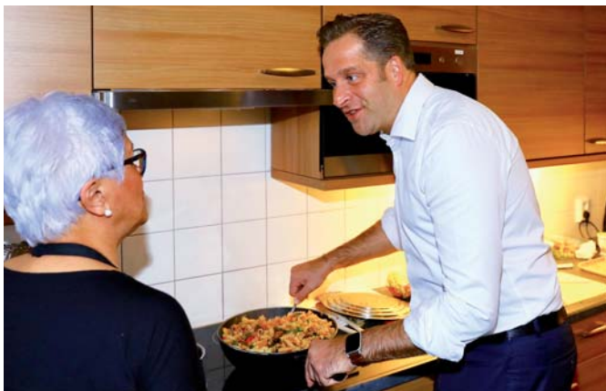
Hugo de Jonge steekt de handen uit de mouwen

Bezoek van Burgemeester Marja van Bijsterveldt bij de uitreiking van de certificaten voor de nieuwe vrijwilligers. Het was fijn dat zij zoveel belangstelling heeft getoond voor het werk van onze vrijwilligers.