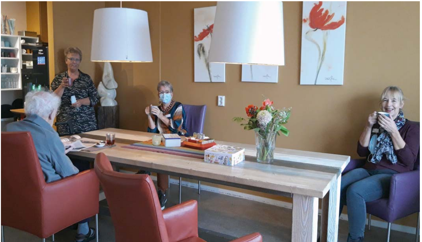
Koffie drinken op afstand met bewoners

Hoe doe je dat? Verbinden – binding, we zijn het zo gewoon. Wij mensen zijn sociale wezens, groepsdieren. Binding en verbinding is een basisbehoefte van elk mens. Het ergens bij horen, dat groter is dan wijzelf, dat inspireert ons, dat geeft ons een reden van bestaan. In het zoeken naar verbinding ligt de kracht van onze organisatie maar hoe werkt dat in deze periode: verbinding houden met elkaar, met de bewoners, cliënten thuis, vrijwilligers, verpleegkundigen? Hoe creëren we verbinding als we elkaar nauwelijks kunnen zien? En hoe zetten we onze creativiteit in om ruimte te maken voor verbinding, ook als dat anders dan anders moet? Verbinding zoeken als je met minder mensen mag zijn en dan ook nog op anderhalve meter afstand, hoe doe je dat? Het is fijn om elkaar toch te spreken en even te horen hoe het met iedereen gaat. We zoomen en bellen wat af met z'n allen: met diegenen die werken en degenen die dat nu even niet doen. Gesprekken om ruimte te creëren voor de ander om zijn of haar verhaal te doen met alle mogelijkheden die er zijn, te bellen, te appen, videobellen, Zoom, Teams waardoor die verbinding gezocht en gevonden wordt.